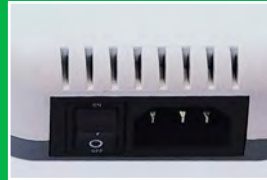
The Back Side (후면)