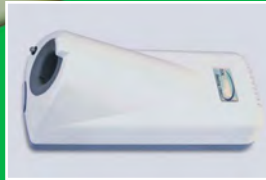
The Side (측면)